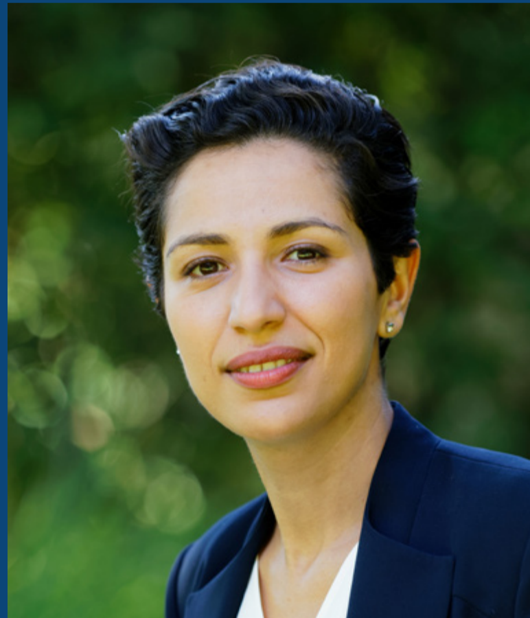
Secrétaire d'État chargée de la Jeunesse et du Service national universel